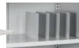
Avskiljare för perforerad hyllplan