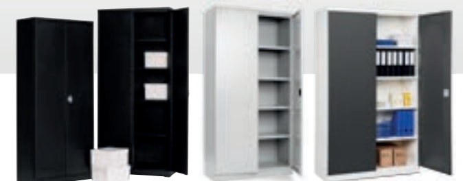
Förvaringsskåp, kontor, arkiv och lager