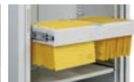
Utdragsram för A4 hängmappar